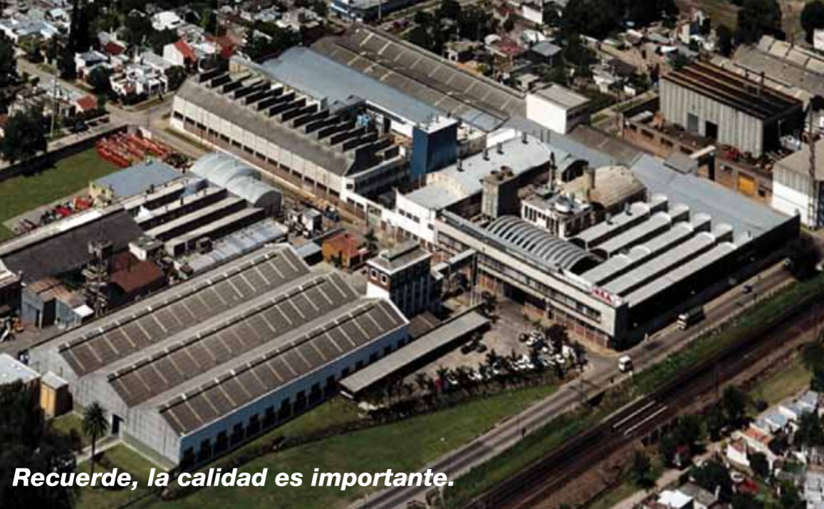
Recuerde, la calidad es importante.

Industria Metalúrgica Sud Americana S.A.